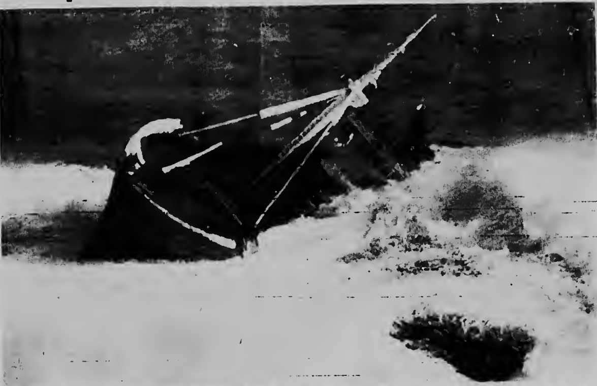
Mientras qu olanan gigantesco ta pasa riba e bapor di pesca "Bonne" qu a pega den barranca net na entrada di haaf di Halifax, na Sur Carolina, e trabaonan di rescate ta continuando pa haña e sobra miembronan di tripulacion. Nan a haña diescuater cadaver caba